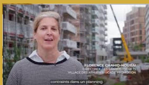
Capsule 3 : Zoom sur le village des athlètes.