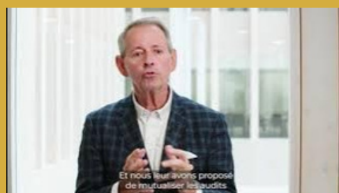
Capsule 5 : France Bois traçabilité : de la forêt aux ouvrages des jeux.