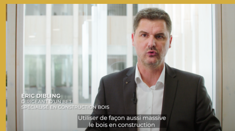
Capsule 2 : Les ouvrages et constructions des Jeux en bois : une montée en compétence réussie