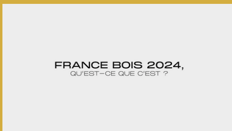
Capsule 1 : France Bois 2024 : qu'est-ce qu'est ?