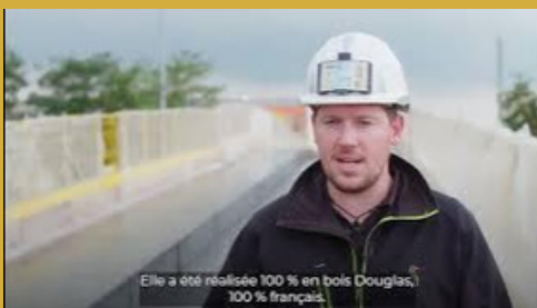
Capsule 4 : Tour d'horizon des ouvrages bois exceptionnels.